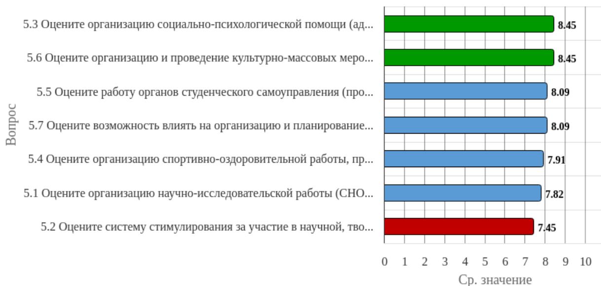
Рисунок 2.5.1 - Распределение показателей уровня удовлетворенности всех респондентов по блоку вопросов «Удовлетворенность организацией внеучебной деятельности»

Индекс удовлетворенности по блоку вопросов «Удовлетворенность организацией внеучебной деятельности» равен 8.04.