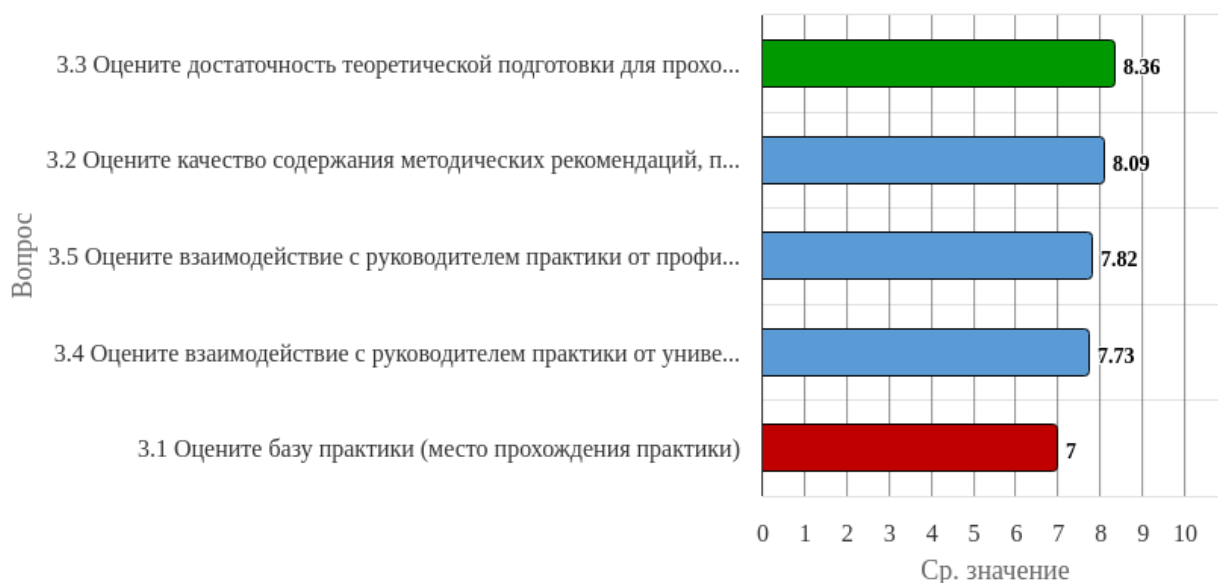
Рисунок 2.3.1 - Распределение показателей уровня удовлетворенности всех респондентов по блоку вопросов «Удовлетворенность практической подготовкой при прохождении практики»

Индекс удовлетворенности по блоку вопросов «Удовлетворенность практической подготовкой при прохождении практики» равен 7.8.