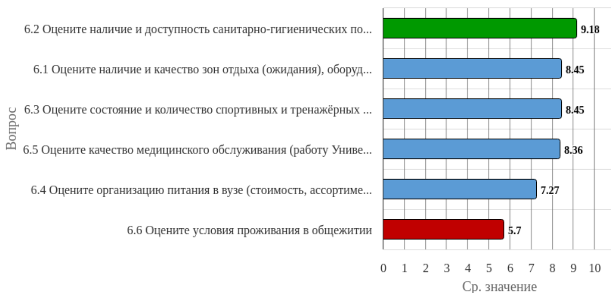
Рисунок 2.6.1 - Распределение показателей уровня удовлетворенности всех респондентов по блоку вопросов «Удовлетворенность условиями университета»

Индекс удовлетворенности по блоку вопросов «Удовлетворенность условиями университета» равен 7.9.