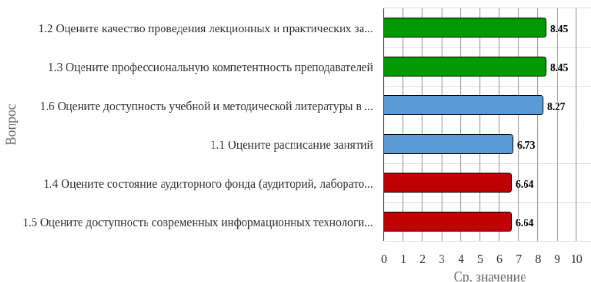
Рисунок 2.1.1 - Распределение показателей уровня удовлетворенности всех респондентов по блоку вопросов «Удовлетворенность организацией обучения»