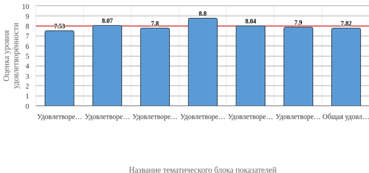
Рисунок 3.1 - Средняя оценка удовлетворенности (по всем тематическим блокам показателей)